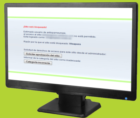
Fig.: Aviso del navegador en caso de un sitio bloqueado

Sí el usuario se encuentra navegando en un sitio web peligroso o desea entrar a un sitio que no ha sido liberado, puede con un clic de ratón solicitar la liberación del sitio. Sí el sitio se encuentra clasificado de forma errónea, puede él mismo comunicárselo a Hornetsecurity. La información será corroborada y procesada.